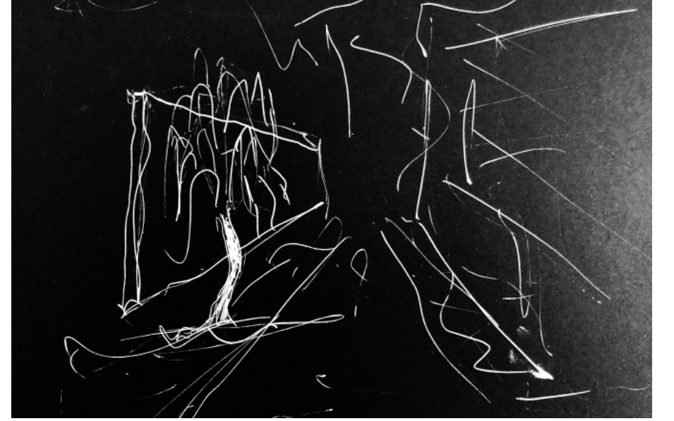
Figür 1: Duvar ve ağaç (eskiz çizimi yazara aittir)

Rüya gibi, sokakla ve ağaçla kurduğum ilişkiyi bu şekilde düşlemek... Bütün çocukların ağaçlarla kurduğu ilişkiyi böylesi karşılıksız bir sevgiye