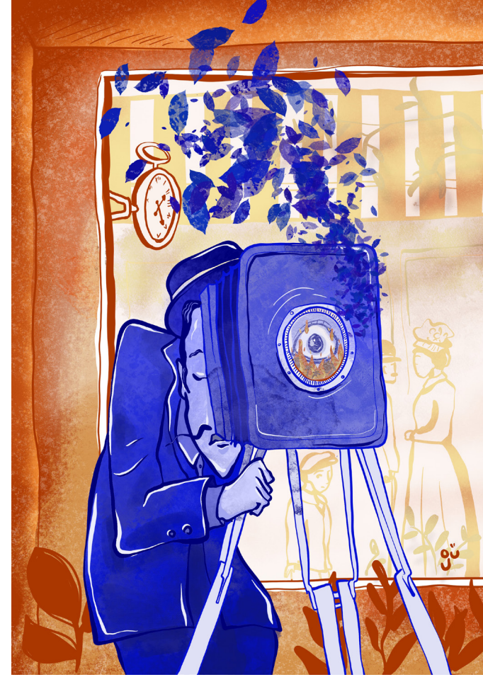
Figür 1: Çizen: Gülsüm Katmer

Sol gözümü vizöre koyup bir fotoğraf daha çektim ve stüdyomun yoluna koyuldum.