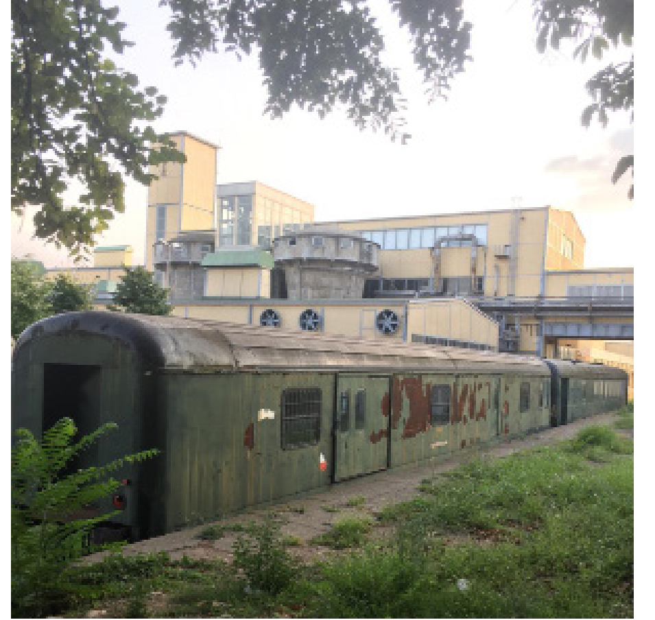
Figür 1: Fotoğraf yazara aittir.

-Aman sen de iyice bunak yaptın beni! Hatırımda elbet. Sana aktarabildiğim her şey bir sonra ki nesle gidecek. Aktaramadıklarım da benimle birlikte toprak olacaklar... (uzun bir sessizlikten sonra) Oğlumun elinden tutuyordum. Koca fabrika karşımızda... Tabi köyde öyle yer mi gördük. Kerpiç evden çıkıp o